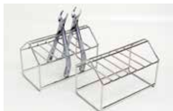
鉗子など7本セット可能 鉗子スタンド AS-186 寸法(mm)：L186×W100×H120