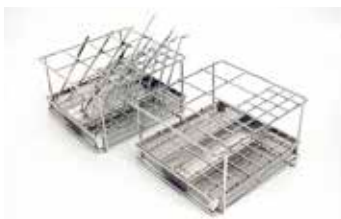
ハンドインスツルメント用スタンド インスツルメントスタンド AS-204 寸法(mm)：L204×W184×H125